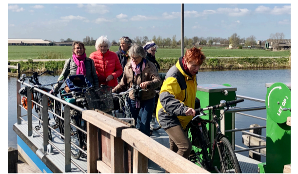
Op excursie naar het Landje van Gijzel, april 2021