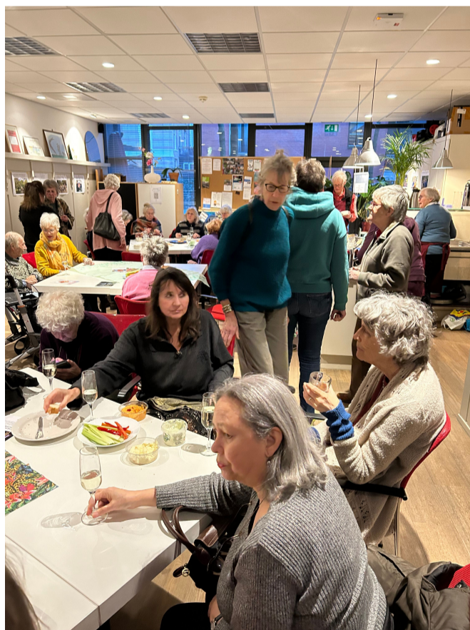
Onze maandelijkse inloop in De Buurman

Aansluitend eten we samen: Iedereen neemt iets te eten mee voor jezelf en voor elkaar.