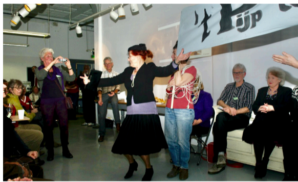
Oprichtingsfeest, Asschergebouw 21 maart 2014