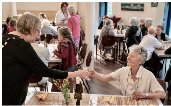
Lustrum feest, Oranjekerk, 18 mei 2019